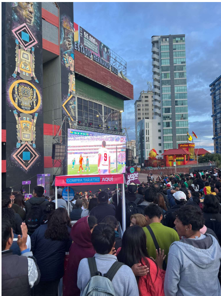
Bolivien vs. Suriname